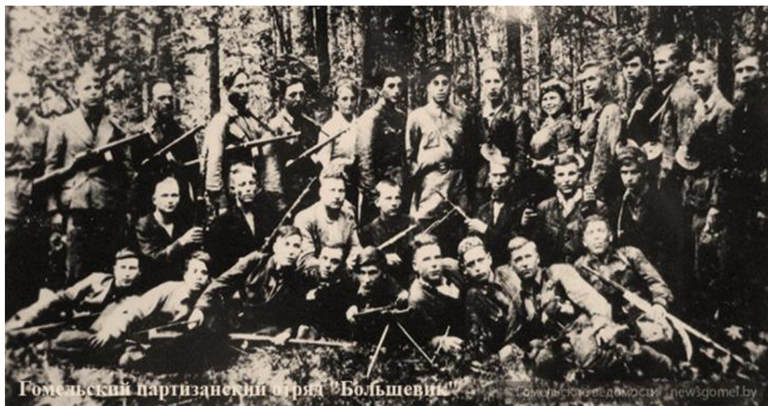
Гомельский партизанский отряд «Большевик»

В мае 1941г., в возрасте двадцати лет она была направлена на курсы политработников.