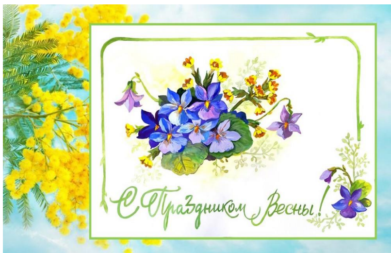
Открытка кружка «Арт-мастерская»