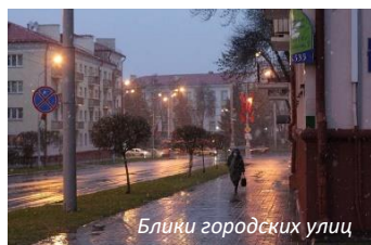
Блики городских улиц