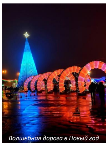
Волшебная дорога в Новый год