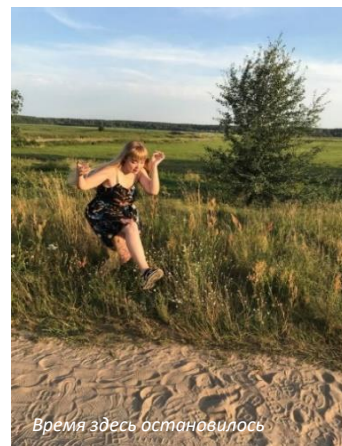
Время здесь остановилось