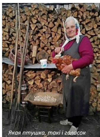
Якая птушка, такі і галасок