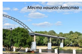
Место нашего детства