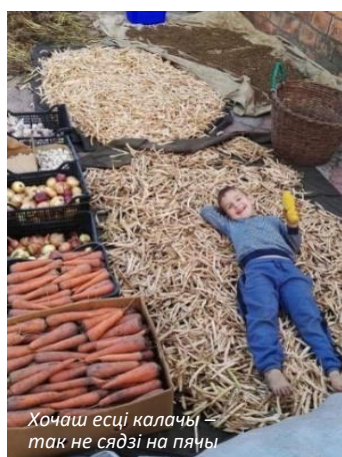
Хочаш есці калачы – так не сядзі на пячы