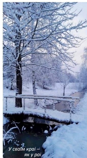
У сваім краі – як у раі