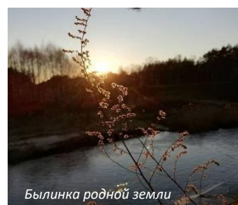
Былинка родной земли