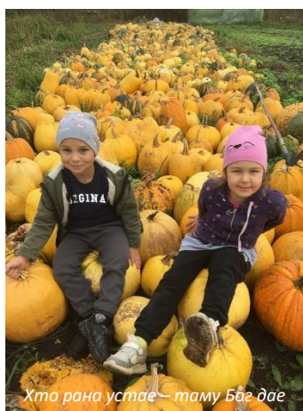
Хто рана устае – таму Бог дае