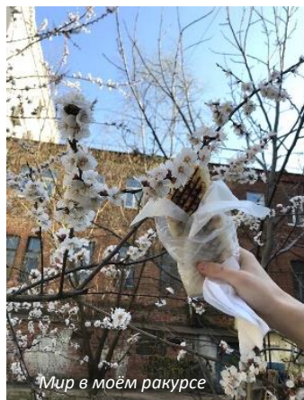
Мир в моём ракурсе