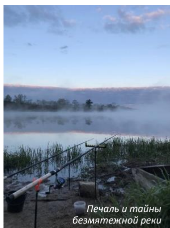
Печаль и тайны безмятежной реки