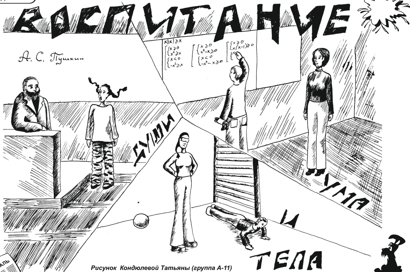
Рисунок Кондюлевоы Татьяны (группа А-11)