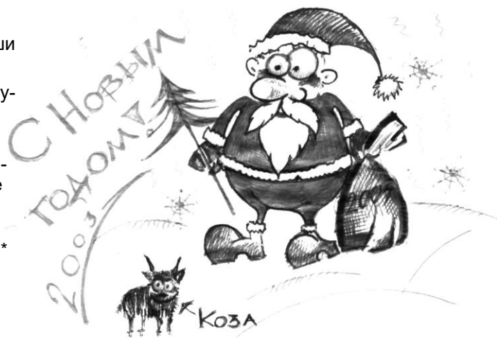
Рисунок Казаченко Т. (А-41)